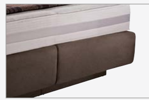
gerade mit Überstand und Sockel