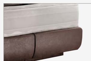
bombiert mit Sockel