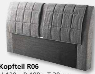
Kopfteil R06 H 120 x B 199 x T 20 cm