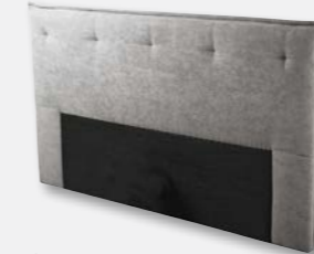
Kopfteil X017 H 122 x B 202 x T 10 cm

Kopfteile, preisgleich, Maßangaben in Höhe x Breite x Tiefe für Standardbreite von 180 cm