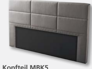
Kopfteil MBK5 H 112 x B 200 x T 13 cm