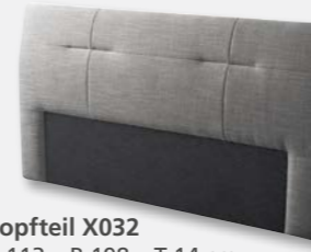
Kopfteil X032 H 113 x B 198 x T 14 cm