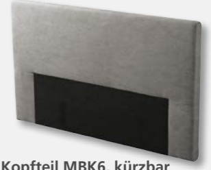
Kopfteil MBK6, kürzbar H 110* x B 202 x T 8 cm Höhenkürzung möglich von 80 - 140 cm, in 5 cm-Schritten *Standardhöhe