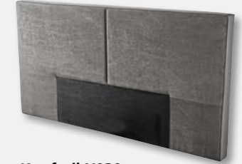
Kopfteil X030 H 116 x B 203 x T 15 cm