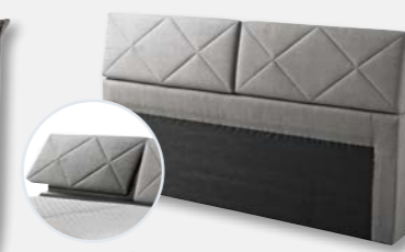
Kopfteil X023, Funktion H 109 x B 198 x T 20 cm Funktion bis Breite 140 cm durchgehend (1-tlg.)