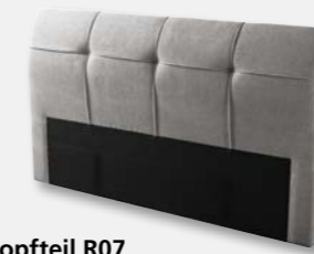
Kopfteil R07 H 107 x B 197 x T 17 cm