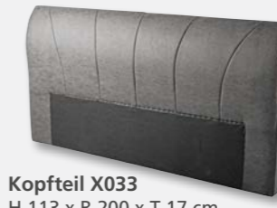
Kopfteil X033 H 113 x B 200 x T 17 cm